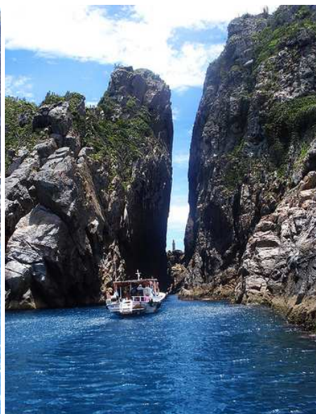
Fenda de Nossa Senhora