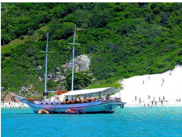
Praia da Ilha do Farol