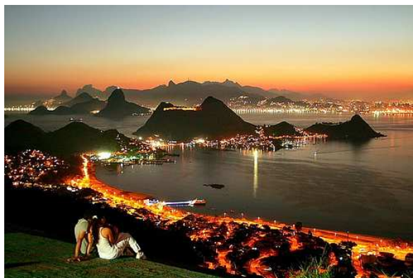
Parque da Cidade - Niterói - Morro da Viração