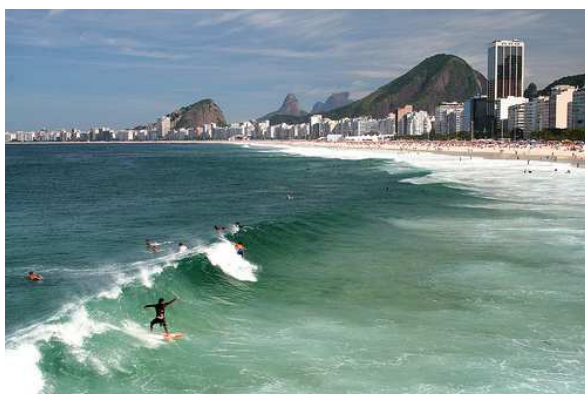
Surf em Copacabana