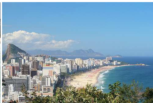
Ipanema - Rio de Janeiro - Brasil