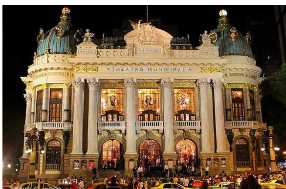
Teatro Municipal Rio de Janeiro