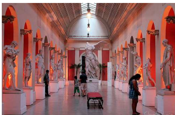
Museu Nacional de Belas Artes