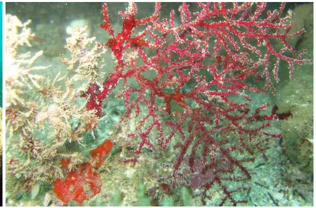
Arraial do Cabo